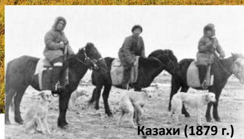
Казахи (1879 г.)

Немцы, русские, чуваша, малороссы, эсты, белорусы и представители десятков других народов ехали в Сибирь, где было много земли, много работы, где можно было говорить на своих языках.