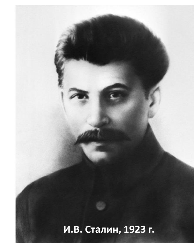
И.В. Сталин, 1923 г.