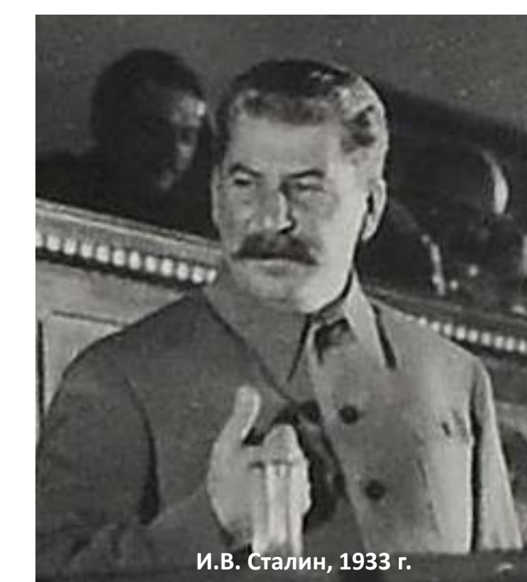
И.В. Сталин, 1933 г.

Новая национальная политика подчеркивала ключевую роль русского народа на идеологическом и культурном уровне. Нападки на русскую культуру были остановлены, «прозападные» культурные ориентации запрещены. Официальные советские подходы с этого времени подчеркивали историческое мировое значение русского пролетариата, который дал всему миру Великую Октябрьскую Социалистическую Революцию.