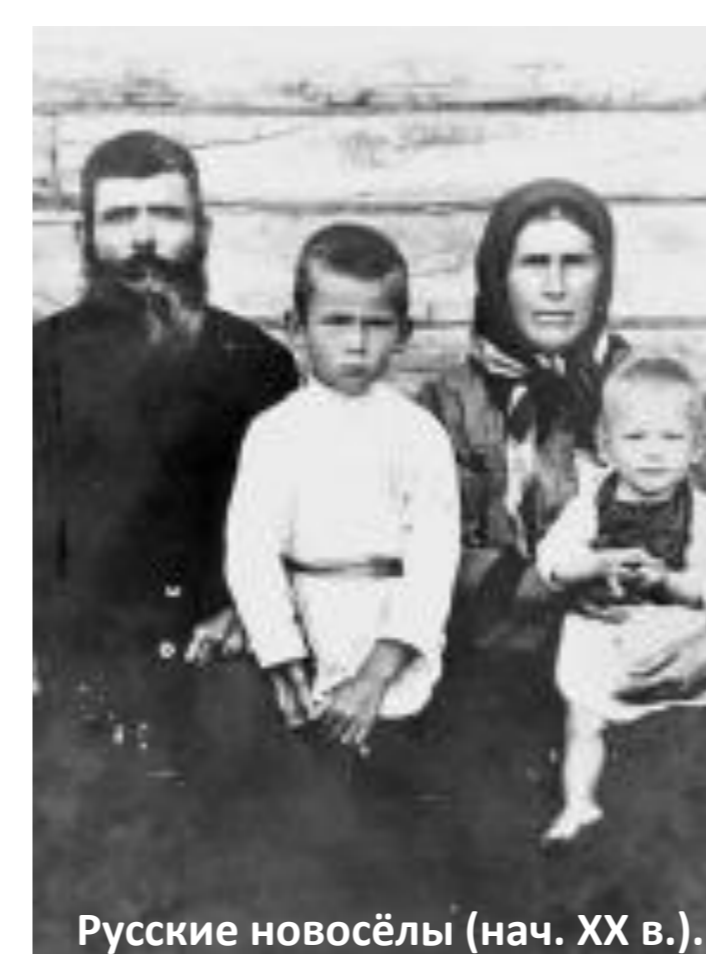
Русские новосёлы (нач. XX в.).