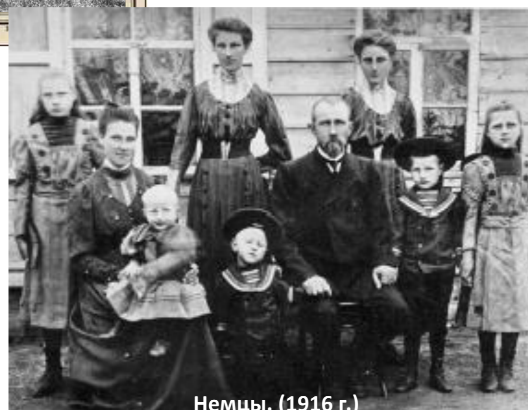
Немцы. (1916 г.)

Немцы, русские, чуваша, малороссы, эсты, белорусы и представители десятков других народов ехали в Сибирь, где было много земли, много работы, где можно было говорить на своих языках.