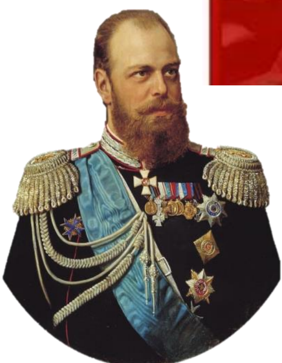
Император Александр III

Политика российского государства в конце XIX – начале XX в. была направлена на создание единого административно-правового и культурного пространства Российской Империи.