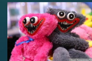
Устрашающий вид токсичных игрушек

Фенол — высокоопасное вещество (класс опасности 2). Он быстро всасывается через кожу, верхние дыхательные пути и желудочно-кишечный тракт. При регулярном контакте с такой игрушкой ребёнок может стать вялым, сонным, возможны головокружения и головные боли, а также местная реакция на коже — покраснения, зуд. Контакт с небольшими дозами фенола также опасен дерматитами, а накопление этого вещества в организме грозит хроническим отравлением почек. Содержание фенола при миграции в водную среду должно быть не более 0,05 мг/дм 3