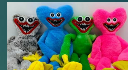
Цветовая гамма данных игрушек

В свободном доступе находится информация о результатах экспертизы игрушек. Из них следовало, что у 89% исследованных образцов было зафиксировано превышение нормы содержания фенола, а у 48% изделий — превышение по показателю «индекс токсичности». Такие нарушения, как отмечали в ведомстве, могут привести к аллергии и раздражению кожи у ребенка. Также у 67% исследованных образцов отсутствовала какая-либо информация о производителе, включая сертификат соответствия