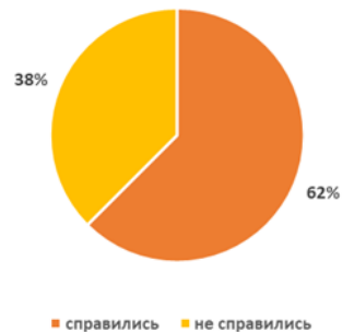
Результаты выполнения задания на соответствие