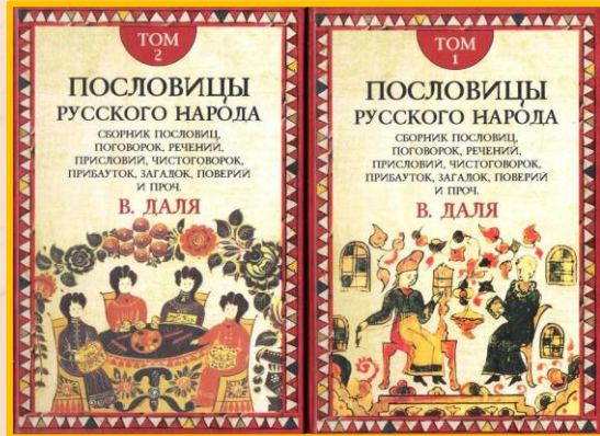
Сборник В.И. Даля «Пословицы русского народа» 1862 г.

Материалы и методы: изучение научной литературы по теме исследования и опрос респондентов (группы ПКД-31, 32, 33).