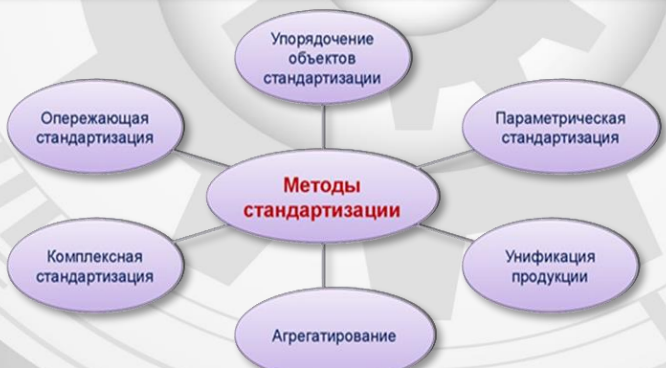
Виды методов стандартизации

Метод стандартизации – это прием или совокупность приемов, с помощью которых достигаются цели стандартизации.