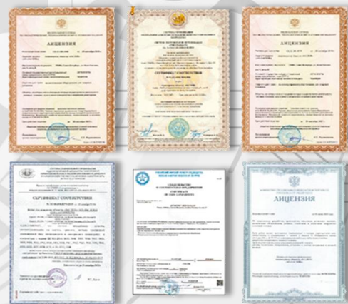
Лицензии и сертификаты АО «Заслон»

Данные полученные из консолидированного отчета о прибылях и убытках свидетельствуют, что используемые методы стандартизации оказывают положительное влияние на экономическое развитие предприятия АО «Заслон».