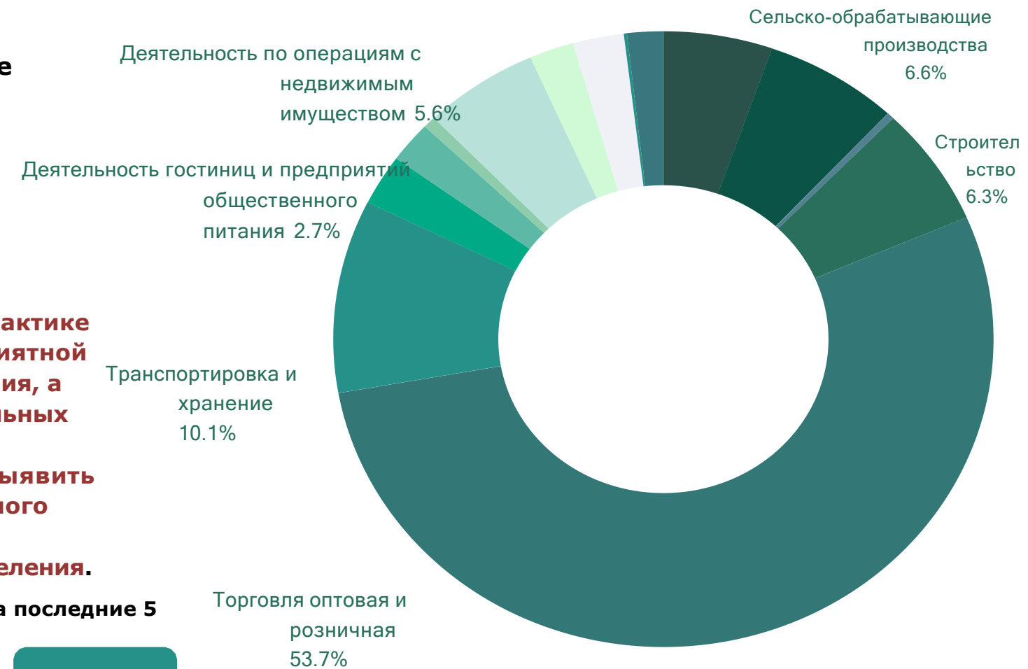
Рис.3 Наиболее популярные отрасли деятельности в Республике Мордовия

ПРАКТИЧЕСКИЕ РЕКОМЕНДАЦИИ: Предоставление доступной и понятной информации о финансовых продуктах и услугах. Государство может требовать от финансовых учреждений предоставлять прозрачную и понятную информацию о своих продуктах и услугах, включая раскрытие всех существенных условий, комиссий и рисков.