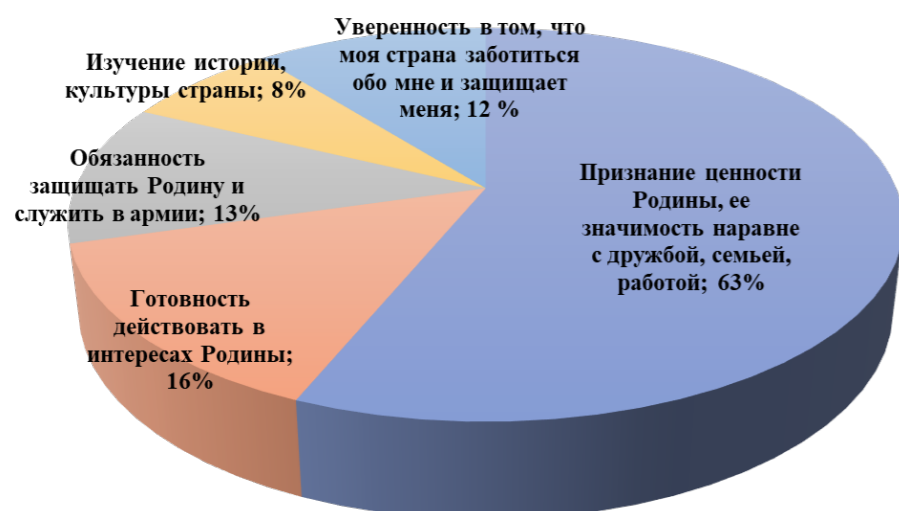
Рис.3. Результаты анкетирования

Материалы: результаты анкетирования. В анкетировании приняли участие 337 студентов четвёртых курсов Российско-Таджикского (Славянского) университета в возрасте от 20 лет, обучающихся по различным программам бакалавриата.