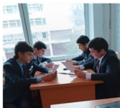
Рис.2. Проведение анкетирования