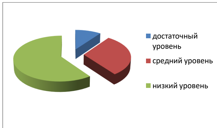
Сформированность произношения у детей с нарушением слуха

Гипотеза исследования – процесс развития звукопроизношения у старших дошкольников с нарушением слуха будет эффективен при реализации комплексного подхода, который предполагает взаимодействие специалистов как в дошкольном образовательном учреждении, так и в дошкольных группах на базе специальной школы-интерната разного направления и использование комплекса разнообразных методов и средств.