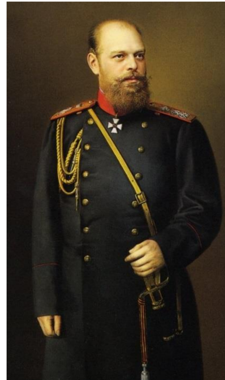
Портрет Александра III (П.П. Заболоцкий, 1889 год)

Многие из этих крестьянских семей оставались в местах своего первоначального компактного проживания на протяжении более чем полутора столетий, сохраняя немецкий язык (в законсервированном по сравнению с немецким языком Германии виде), веру (как правило, лютеранскую, католическую) и другие элементы национальной культуры.