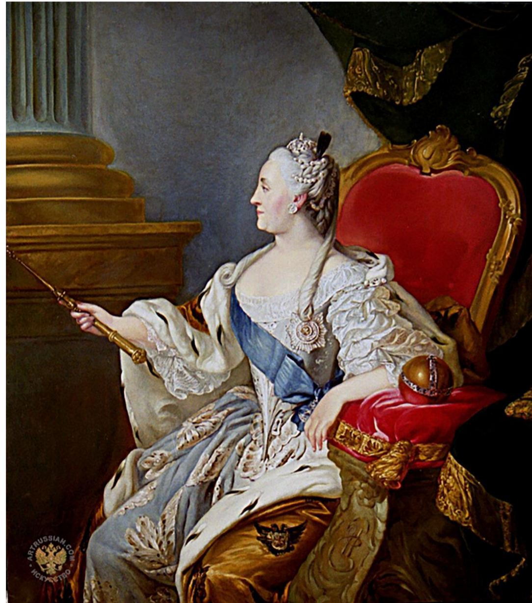
Портрет Екатерины II (Ф.С. Рокотов, 1763 год)

Манифест «О дозволении всем иностранцам...», опубликован 22 июля 1763 г.